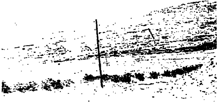
سهل ابل السقي

حاصبيا - الانوار: بدأت القوات الاسرائيلية أمس بتفكيك منشآتها في سهل ابل السقي تفجيرا للاستحباب من القطاع الشرقي. وقد استخدمت القوات الاسرائيلية رافعات ضخمة وجرافات ثقيلة لرفع البيوت الجاهزة ونقلها على متن الشاحنات الى اسرائيل ومن ثم دمرتها الدشم والتحصينات والمباني والسواتر القائمة حول المعسكر. ويشكل هذا المعسكر نقطة انطلاق للقوات الاسرائيلية المؤلفة من القطاع الشرقي. وقد انطلق منه عند ساعات الظهر طلوع مدفع قواحه ٢٥ مائة والية مجنزرة ترافقه صهاريج للمحروقات وسيارات اسعاف وغرفة عمليات ثقيلة وتوزعت على مواقع محاور التفرع وعن قننا وحاصبيا وعادت عند المساء الى قواعدهما في معسكر السهل. ولم تفلح بويات الحور الى الشمال من الحزام الأمني كما كان متوقعا أمس وبقيت منطقة حاصبيا معزولة عن النطاق عندما قطعت القوات الاسرائيلية جميع الطرق من قننا والطرق الترابية الغربية الخاصة بالمشاة. وأسر دخلت سيارة مبنية نقل